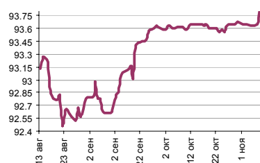
Индекс рубля к корзине валют (50% $, 50% €)